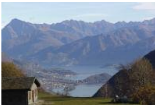
Pian delle Alpi

La prima parte del sentiero 1 si inerpica in direzione del Monte Bisbino; la seconda parte, molto panoramica e più pianeggiante, aggira il versante nord del Sasso Gordona con le sue gallerie e postazioni militari della prima guerra mondiale.