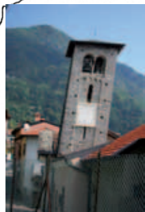
SS. Bartolomeo e Nicola