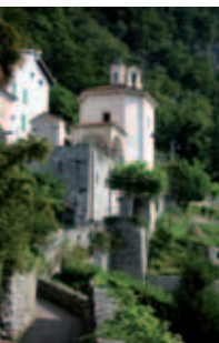
Santuario Regina della Pace