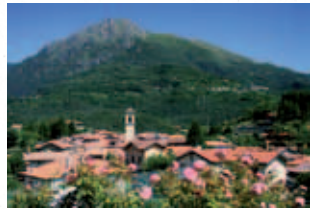
Frazione di Croce