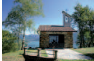
Chiesetta degli alpini