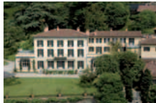
Villa Mylius Vigoni