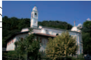
SS. Lorenzo e Agnese